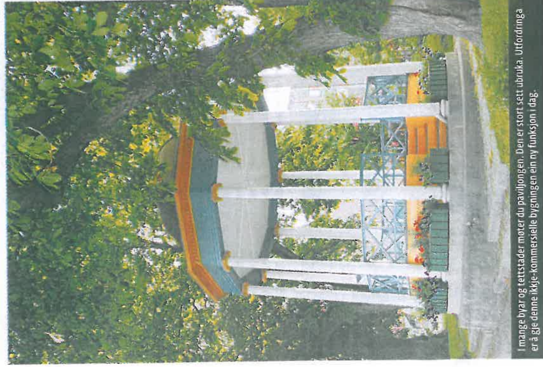
I mange byar og tettstader møter du paviljongen. Den er stort sett ubruka. Utfordringa er å gjere denne ikkje-kommersielle bygninga ein ny funksjon i dag.

Ein skulle vente at dette var eit prinsipp i alle fall eit fåtal norske tettstader fylgde. Men nei. Eg har berre funne ein bygdeby som