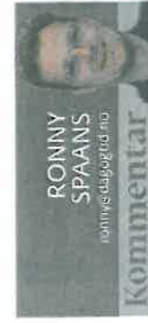
RONNY SPAANS opplagsdagstid.no Kommentar

Ein ny type norsk by er i ferd med å vekse fram. Der er kjøpesentret, ikkje rådhuset eller torget, det naturlege sentrum. Taparen er lokal-demokratiet.